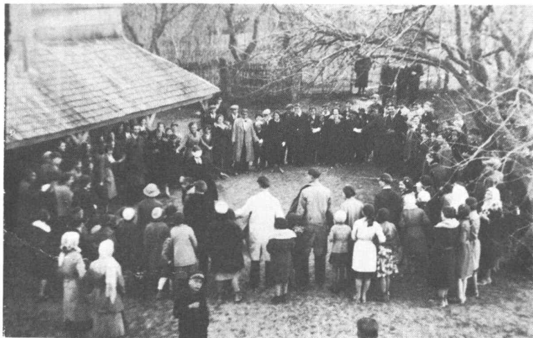
Церковця св. Миколая на Адамівці в Бережанах. Виводять Великодніх гагілок і забави.