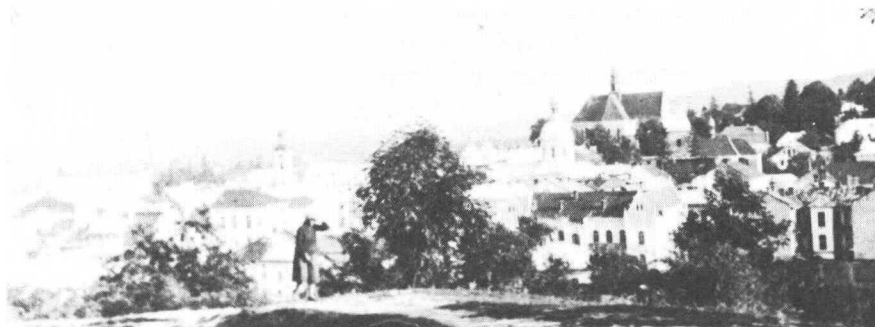
Інший варіант виду Бережан з боку гори Сторожисько.

го жадного хісна, бо сам творець його висказував пророцтво, що після 25-ти р. діяння цього закону – українська справа взагалі перестане бути актуальною... У 1925 році українські батьки із сорока громад подали свої заяви до інспекторату за приблизну кількість двох тисяч дітей; у 1932-гim внесено до Бережанського інспекторату ще більше таких заяв – усі вони залишились без відповіді. На скаргу батьків до адміністраційного трибуналу у Варшаві, трибунал визнав скаргу і домагання батьків правно і фактично обґрунтованими, але повітовий інспектор робив своє !..