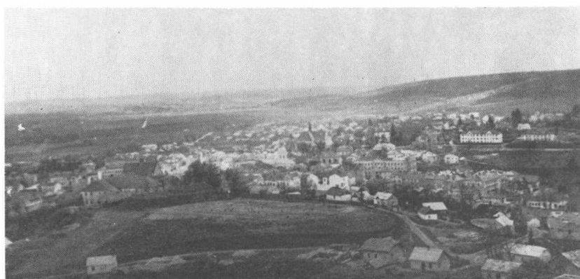
Мініатурний вид Бережан з Бабиної гори.