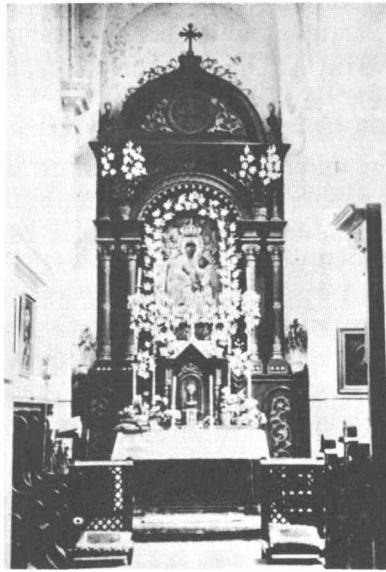
Чудотворний образ Божої Матері (так зв. римської) в церкві св. Троїці в Бережанах.