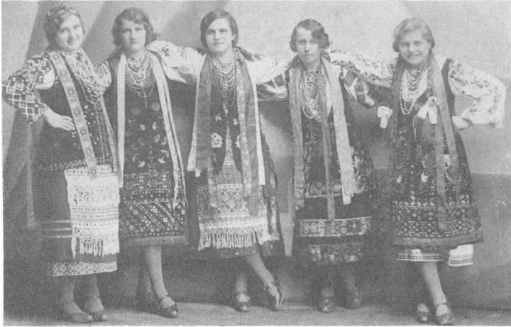
Танець „Аркан” виконаний членкинями жіноч. секції молоді на святі Просвіти в Бережанах у 1934 р. Дівчата в гарних народніх строях.