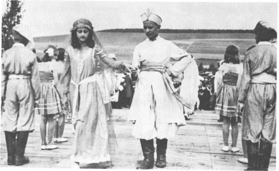
Повітове свято „Рідної Школи” в Березанах в 1936 р. „Живі шахи”, виконували- грали учні „Р.Ш.”, проводив ред. Петро Сагайдачний.