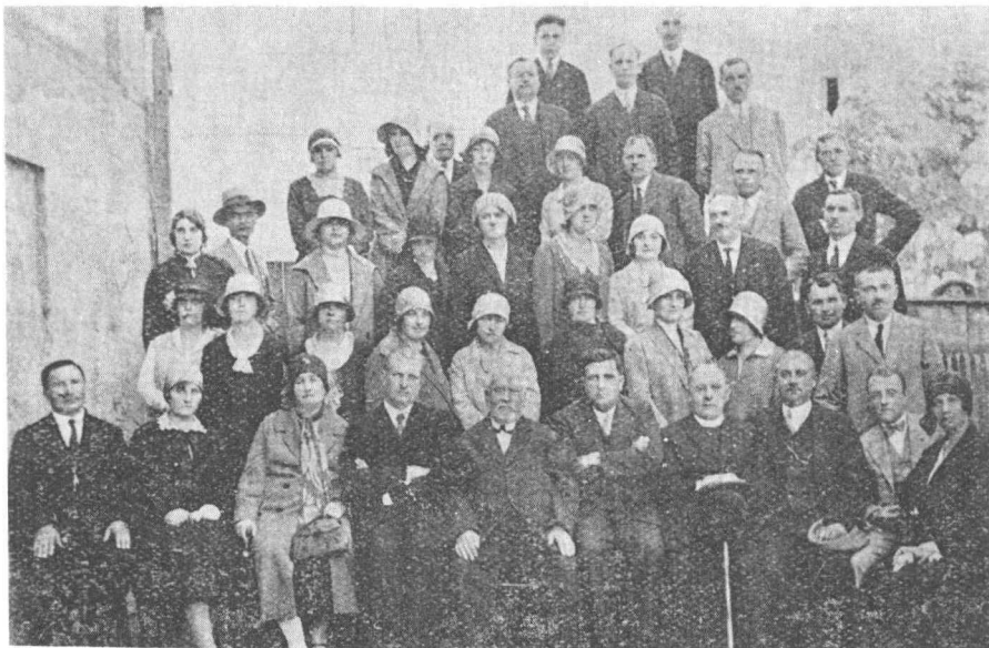
Учителі й учительки на Бережанщині, члени тов. В П У У в 1930 р.

Для оборони станових потреб та прав, загал українського вчителства зорганізував свою крайову установу – товариство „Взаємна Поміч Українців Учителів” (В оригіналі – „Взаїмна”) у Львові. 1905 року постав у Бережанах відділ цього товариства. Вчителство в повіті творило здисципліновану громаду і дало справді багато в громадському житті повіту. Між членами була товариська солідарність. У роках 1904 – 1910, коли повітовим шкільним інспектором був о. Василь Навроцький, відділ був одним із найкращих на заході України. До того часу повітовим інспектором у Бережанах був поляк або спольщений німець. Тому вони протегували вчителів-поляків і їх призначали на посади. Але за діяльності о. В. Навроцького в повіті вчителі - українці сягали 70% загальної кількості вчителства. Також і в міських школах працювали декілька вчителів - українців. Політика шкільного інспектора о. Навроцького не була по душі полякам, і вони робили неперербірливі заходи про перенесення його до іншого повіту.