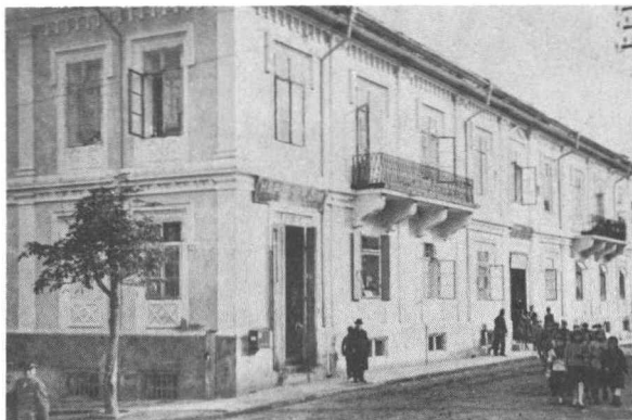
Будинок „Рідної Школи” в Бережанах. Наука покинчена, діти відходять додому.