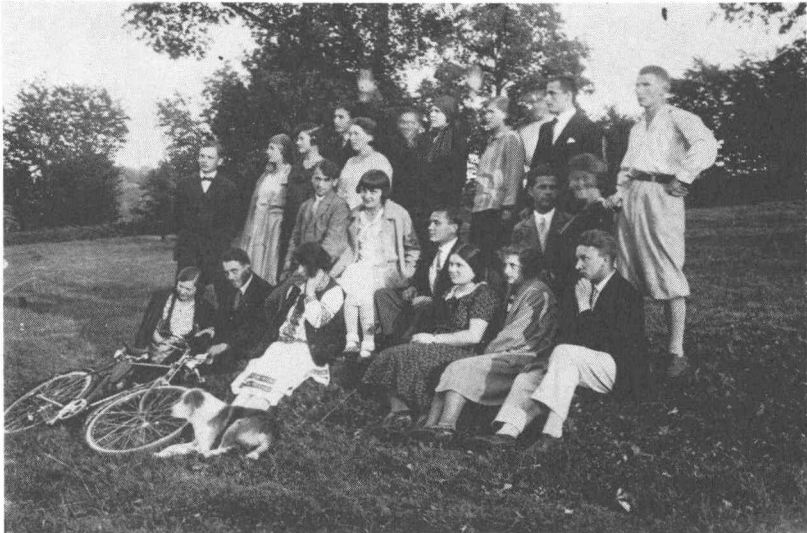
Бережанські студентки і студенти на прогулянці серед зелені.